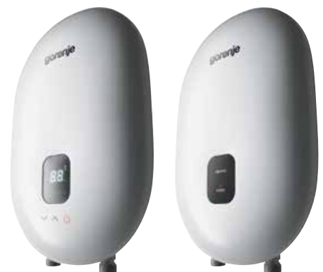
EFWH 3000 L

** Za priključenje bojlera potrebno je upotrebiti slavinu sa tri priključka (slavinu za boiler bez pritiska).